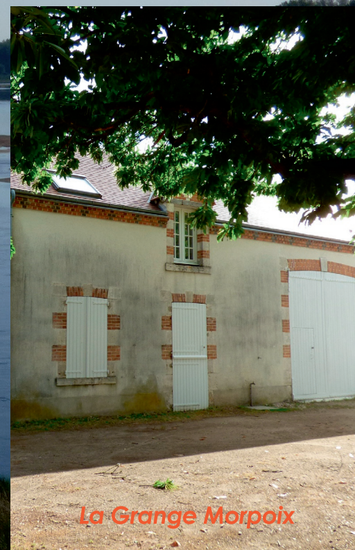
La Grange Morpoix

En complément, la Maison Bel, ancienne crèche communale est devenue « Maison du patrimoine » pour accueillir les associations concernées, des expositions et une partie des archives constituées au fil du temps.