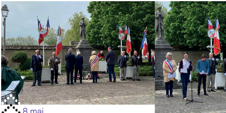
8 mai CÉRÉMONIE DU 8 MAI 2023