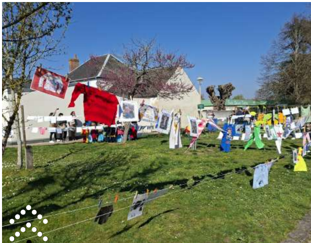
LA GRANDE LESSIVE