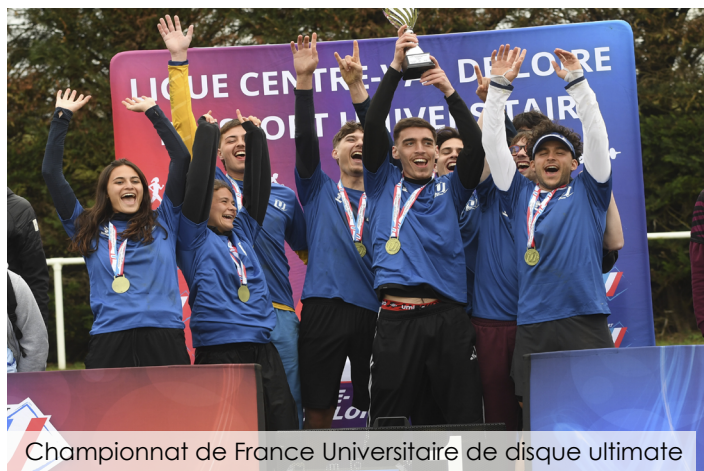
Championnat de France Universitaire de disque ultime