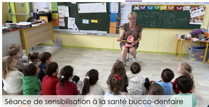
Séance de sensibilisation à la santé bucco-dentaire