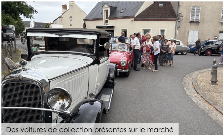
Des voitures de collection présentes sur le marché