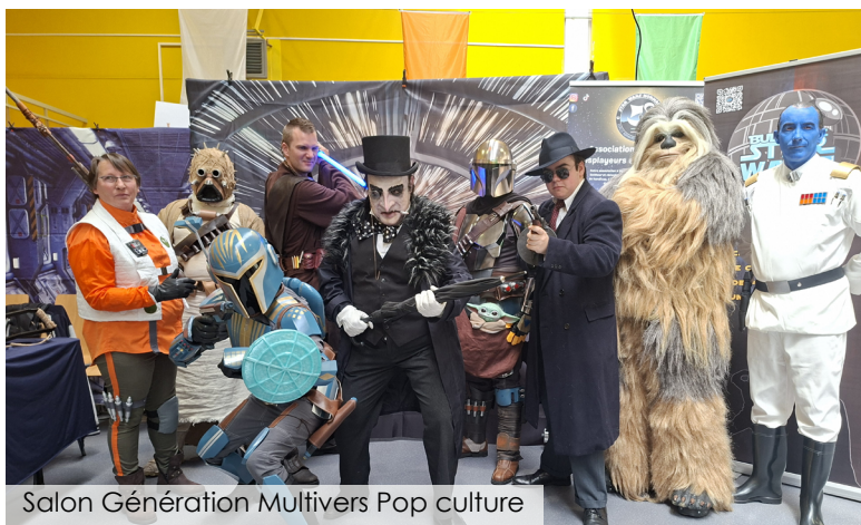
Salon Génération Multivers Pop culture