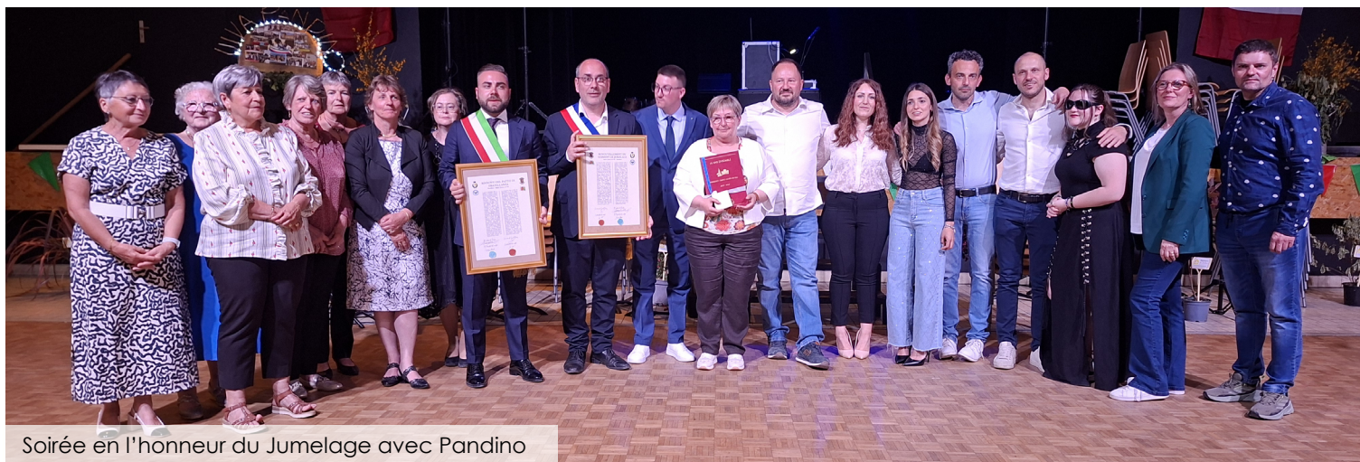
Soirée en l'honneur du Jumelage avec Pandino